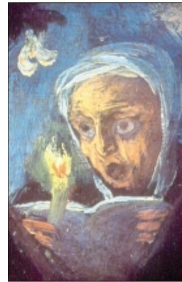
Goya en sus pinturas negras refleja un mundo a medio camino entre la realidad y la ficción. En esta pintura representa a una bruja.

Una de las leyendas más conocidas es la que se conmemora el primer viernes del mes de mayo. Los jacetanos, bajo el mando del conde Aznar, vencieron a las tropas musulmanas, mucho más numerosas,