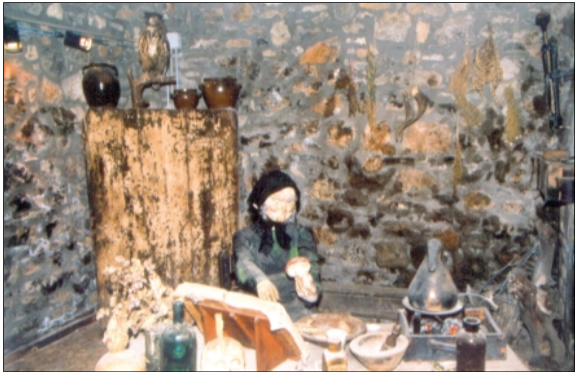
El Pirineo es escenario de historias y leyendas de brujería. La bruja del Museo de Tella es representativa de la mujer mayor que vive sola con sus pócimas y brebajes y a la que todo el pueblo acusa, la mayor parte de las veces sin fundamento, de prácticas brujeriles.

Una bella leyenda recuerda los orígenes del monasterio de San Juan de la Peña. Juan de Atarés, un caballero cristiano de familia no-