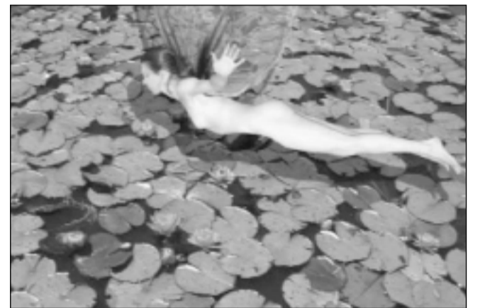
Fotograma del vídeo "Insect". S.E.

vimiento, 2001, Reino Unido), de David Anderson; "Cum pane" (Compartir el pan, 2002, Suecia), de Anna Linder; "Serial flowers" (Flores en serie (2003, Italia), de Beniamino Borghi, Federico Gabbiani y Mariella Pederbelli; "Burts" (Explosión, 2003, Islandia), de Reiner Lyngdal; "Marsa abugalawa" (2004, Holanda), de Gerald Holthuis; "Strip Melody" (Melodía de tiras, 2005, Italia), de Vincenzo Beschi; "Insect" (Insecto, 2006, Australia),