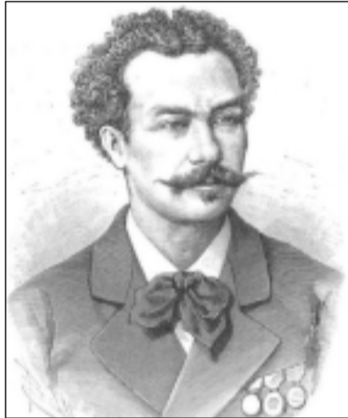
El andarin italiano Achilles Bargossi. Retrato de Félix Badillo publicado en La Ilustración Española y Americana