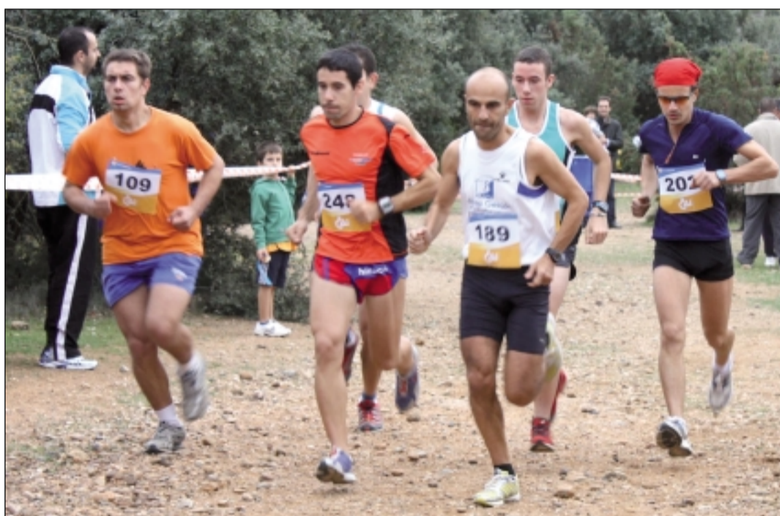
Un momento de la carrera absoluta masculina N.L.A.