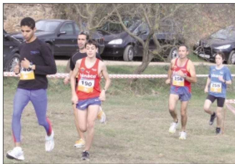
Carrera para juveniles y veteranos en Benabarre N.L.A.