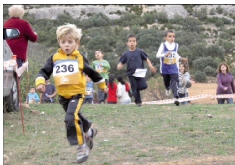
Los más pequeños, uno de los mayores atractivos N.L.A.