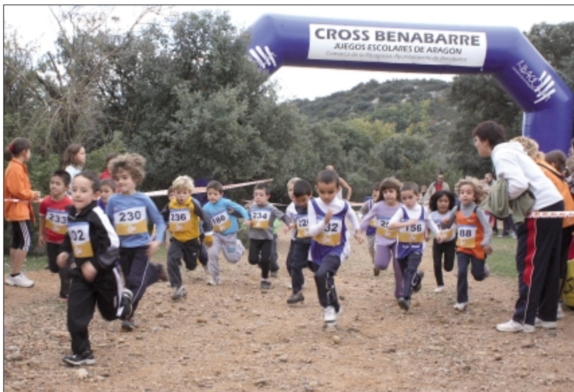
Salida de la carrera prebenjamín N.L.A.