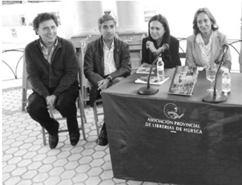
Presentación de ‘Alrededor de la obra de Julio Verne’.

Se trata de ocho trabajos muy diferentes, con el único nexo común que es Julio Verne. Así, incluye un estudio de las traducciones que se hicieron de sus relatos cortos y de Viaje al centro de la tierra , y analiza, por otro lado, la imagen de la mujer en Miguel Strogoff. Igualmente, se pueden encontrar investigaciones sobre Cinco semanas en globo, la repercusión de la revolución indus-